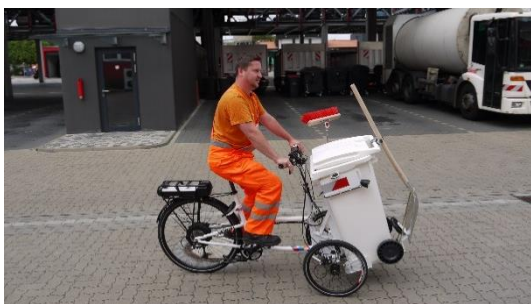
Testfahrt mit einem Elektro-Lastenrad im Rahmen eines Forschungsprojekt