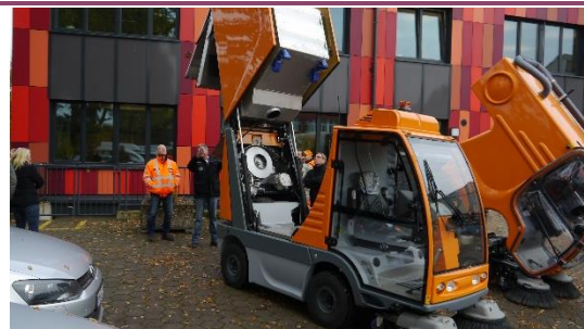
Vorstellung einer Elektrokehrmaschine