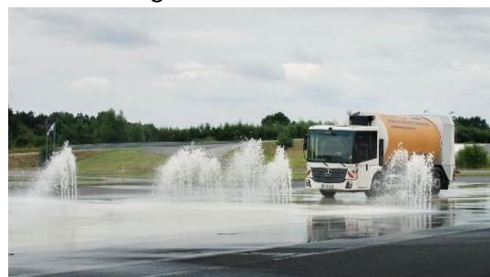
Kontinuierliches Fahrtraining für Sicherheit und Treibstoffeinsparungen