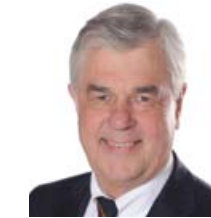
Frank Horch , Senator für Wirtschaft, Verkehr und Innovation

„Jedes Ziel in der Metropolregion Hamburg soll spontan und unkompliziert mit verschiedenen ineinander greifenden Verkehrsmitteln erreicht werden können.